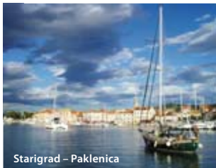
Starigrad – Paklenica